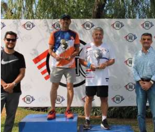
Torneo Aniversario del CIT

Desde que asumimos como comisión, realizamos reuniones de forma mensual y nos dedicamos con compromiso a cumplir varios objetivos tanto en lo deportivo como en lo social.