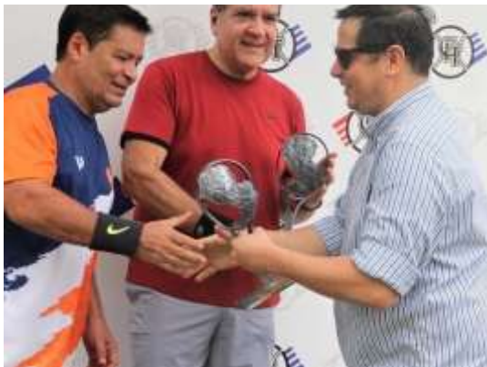
Torneo Aniversario del CIT

A fines del mes de Julio del 2022 participamos del torneo InterClubes Aniversario del CIT, campeonando y consiguiendo podios en distintas categorías y quedándonos así con el Vice Campeonato general de entre todos los Clubes participantes.