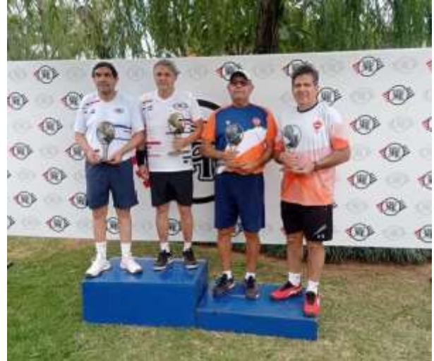
Torneo Aniversario del CIT