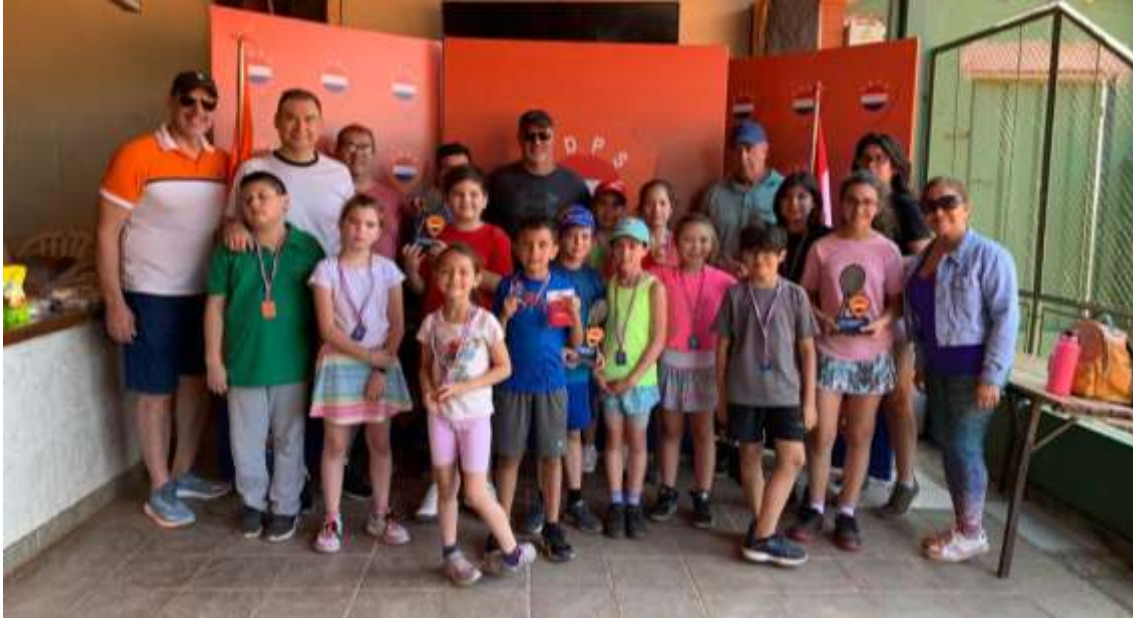
Escuelita de Tenis