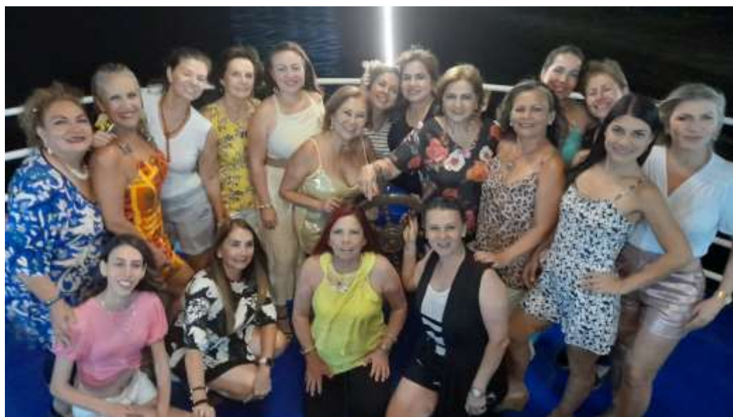
Cena y premiación de Fin de Año del Tenis

También realizamos actividades sociales, como ser la Fiesta del día de la amistad del Tenis en el Pub Naranja, con sorteo de premios para los participantes. Y para cerrar, en el barco Cuñataí celebramos la fiesta de fin de año del Tenis con sorteo de premios para los participantes en el y premiación del torneo de maestros.